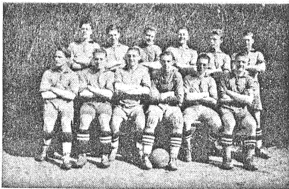
Billesholms G. & I. F.s representat- ionstag.